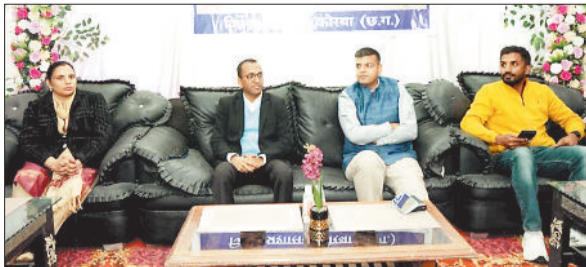
कार्यक्रम में उपस्थित अजीत वसंत एवं अन्य।

कोरबा जिले की प्रशासनिक यात्रा में 18वें कलेक्टर के रूप में अजीत वसंत का कार्यकाल संवेदनशीलता, दृढ़ निर्णय और विकास के स्पष्ट दृष्टिकोण से भरा एक उल्लेखनीय अध्याय बन गया है। 4 जनवरी 2024 को जिला कार्यालय में पदभार ग्रहण करते समय उन्होंने यह स्पष्ट कर दिया था कि उनका कार्यकाल केवल प्रशासनिक दायित्वों तक सीमित नहीं रहेगा, बल्कि आमजन के जीवन में सकारात्मक बदलाव लाने का माध्यम बनेगा। लगभग दो वर्षों के