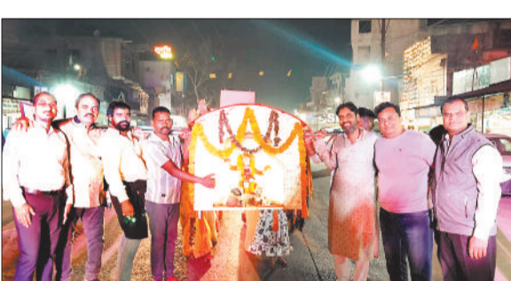
साईं पालकी यात्रा में शामिल श्रद्धालु एवं झांकी।

हरिभूमि न्यूज ►► कटघोरा साईं समिति कटघोरा के तत्वावधान में हर वर्ष की भांति इस वर्ष भी नगर में भव्य एवं ऐतिहासिक साईं