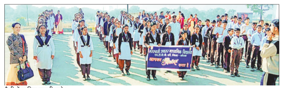
रैली में शामिल स्कूली बच्चे।