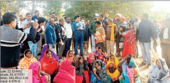
घटना स्थल पर परिजनो को सहायता राशि देते वन विभाग के अधिकारी।