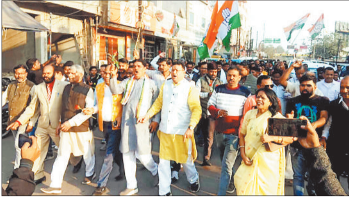
घेराव में शामिल कांग्रेसी।

खास बात कांग्रेसियों ने सुप्रीम कोर्ट के फैसले को बताया सत्य की जीत