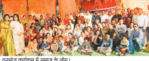
वनभोज कार्यक्रम में समाज के लोग।