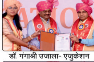
डॉ. गंगाश्री उजाला - एजुकेशन