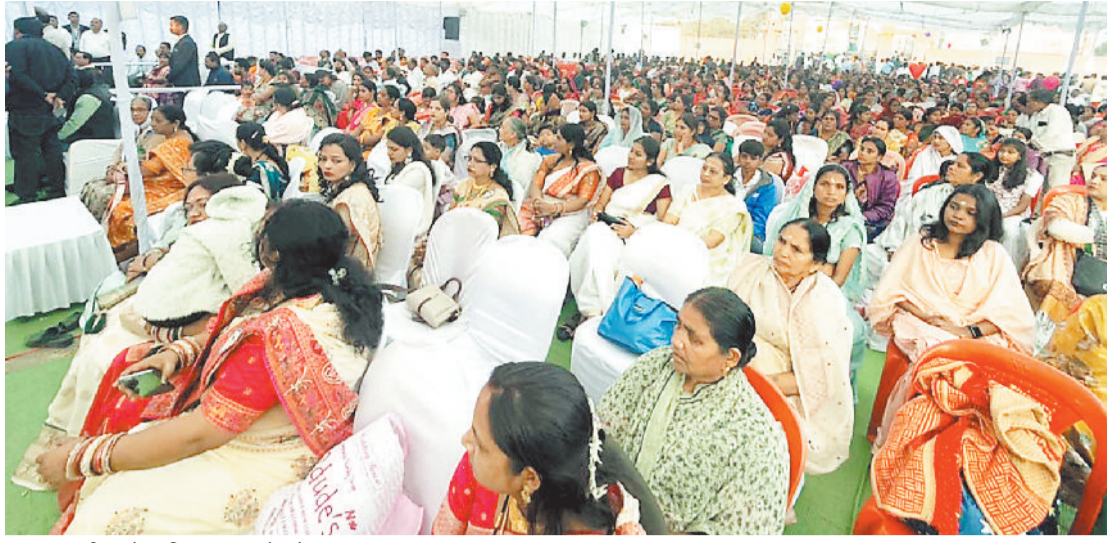
कार्यक्रम में उपस्थित समाज के लोग।