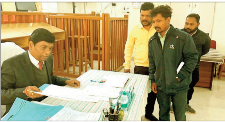
प्रकरण का निराकरण करते न्यायाधीश।